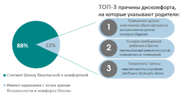
Рисунок 1. Результаты исследования обстановки психологического комфорта в Школе