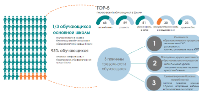
Рисунок 2. Анализ причин тревожности в школьной среде.

На основании представленных выше данных можно сделать вывод об удовлетворительном уровне организации воспитательной работы Школы в 2023 году.