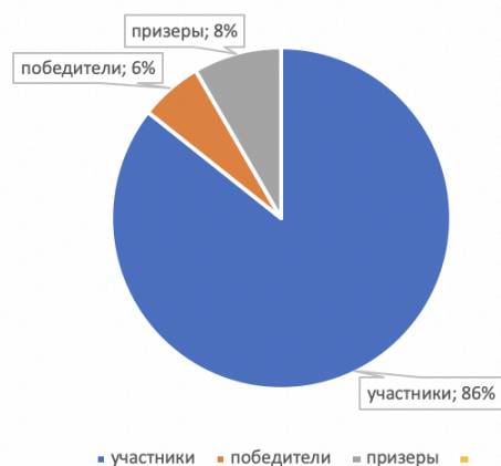
Рисунок 4. Сравнительные результаты муниципального этапа ВСОШ

На региональном уровне участвовали 9 человек, из них 8 стали призерами данного этапа.