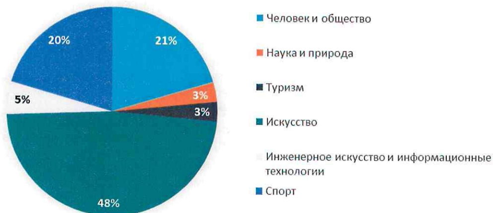
Распределение выбора направленности дополнительного образования в 2025 г.

В диаграмме отражено распределение выбора направленности дополнительного образования в 2025 г.